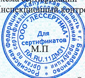
Схема сертификации – 1с(м). Инспекционный контроль – декабрь 2026г., декабрь 2027г.