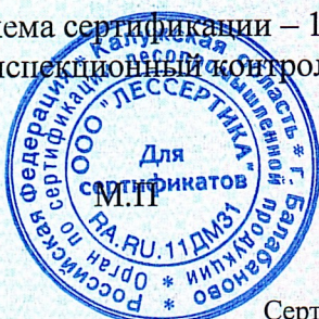
Схема сертификации – 1с(м). Инспекционный контроль – май 2027г., май 2028г.